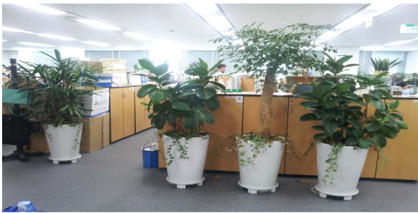
Fig. 1. Indoor plants placement in the newly-built office.

제거능이 뛰어나고 손쉽게 구할 수 있는 식물 중 6종(농촌진흥청 추천식물)을 사무실에 배치하였다. 적응 식물은 관음죽, 인도고무나무, 팔손이 총 3종, 자생식물로는 천사의 눈물, 아이비, 스킨답서스 총 3종을 선정하였다. 식물 화분은 두 종류의 다른 식물을 사용하여 대품(Large plants)과 하부식재(Under planting)로 구분하여 식물을 적용한 사무실 공간에 화분 10개씩(대품 10개, 하부식재 10개)을 보행과 업무에 지장이 없되 재실자에 근접할 수 있는 사무실 공간 곳곳에 적용하였다(Table 3, Fig. 1).